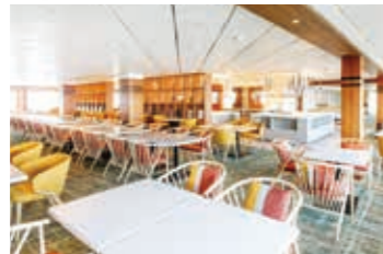
11階 リドカフェ&リドガーデン

海と空を大パノラマで眺めながらの朝風呂は、爽快感もひとしおです。「グランドスPA」は従来の大浴場から屋外にも空間を拡張し、露天風呂を新設しました。