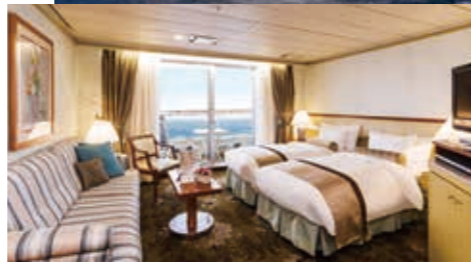
Cスイート —プライベートバルコニー付/33.5㎡