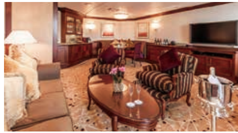
Sロイヤルスイート —プライベートバルコニー付き/88.2㎡