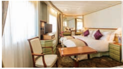
D3ディートリップ —角窓(バルコニーなし)/22.9㎡