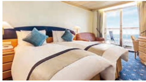
D・Eバルコニー —プライベートバルコニー付き/22.9㎡