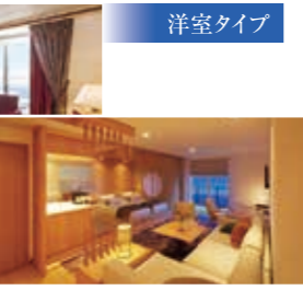
Aアスカスイート —プライベートバルコニー付/45.8㎡