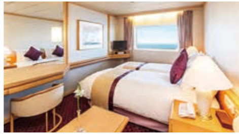
F・Kステート —角窓(バルコニーなし)/18.4㎡