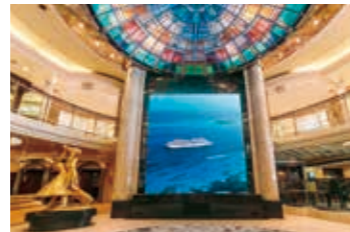
5階 アスカビジョン

「リドガーデン」はアイランド型のビュッフェカウンターを取り入れ、さらにライブキッチンも登場。明るい色調のインテリアに変わりました。